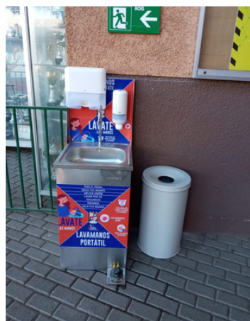
Instalación seis lavamanos