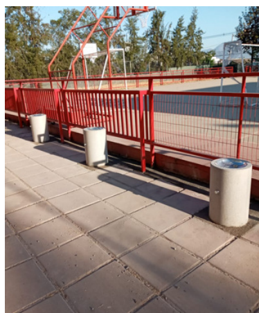
Instalación de seis bebederos en multicancha

Con el fin de hacer más agradable la estadía de los alumnos durante sus clases presenciales y con aún mayor seguridad e higiene, durante los últimos días, el colegio ha mejorado especialmente distintas dependencias: