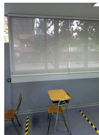
Instalación de cortinas en salas en 1er y 2do pabellón