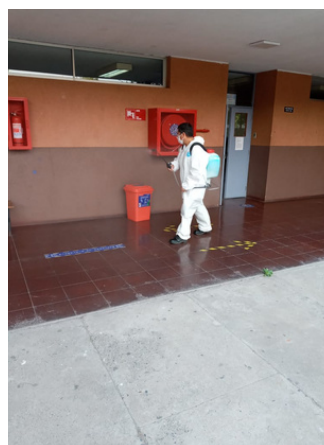
Sanitización realizada empresa externa